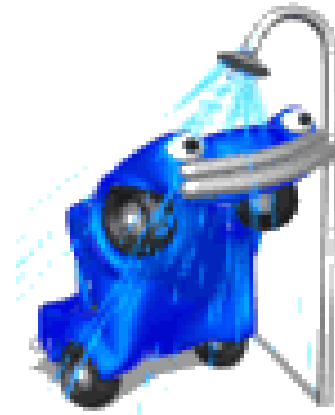
De auto wast zich

Ik was me Je/ jij wast je Hij wast zich Zij wast zich U wast zich / u